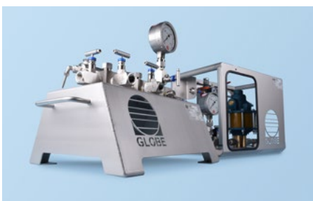
Hoge druk manifold