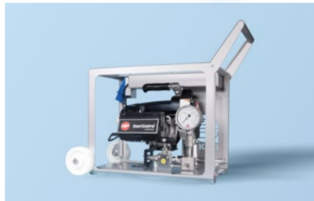
Elektrische aangedreven hoge druk test systemen