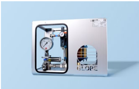
Lucht aangedreven hoge druk test systemen