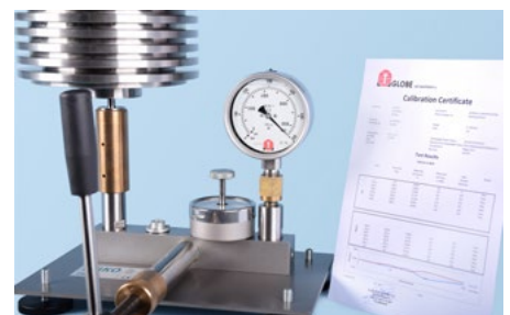
Onderhoud en certificering